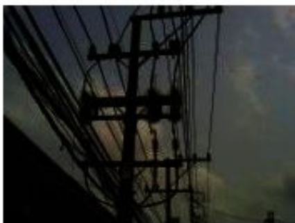
ภาพที่ 1 ก่อนการแก้ไข (ภาพจริง)

กพฟ. กพฟ. ล้อมน้อย สถานีไฟฟ้า ล้อมน้อย 1 (ONA) ระบบ 22kV ว่างร 09VB01 จาก QNA95-01 - QNA95-06 และ ล้อมปาดูจนา ถึง QNA95-12 (ห้อง UCM) ระยะทาง (ว่างร-กม.) 6